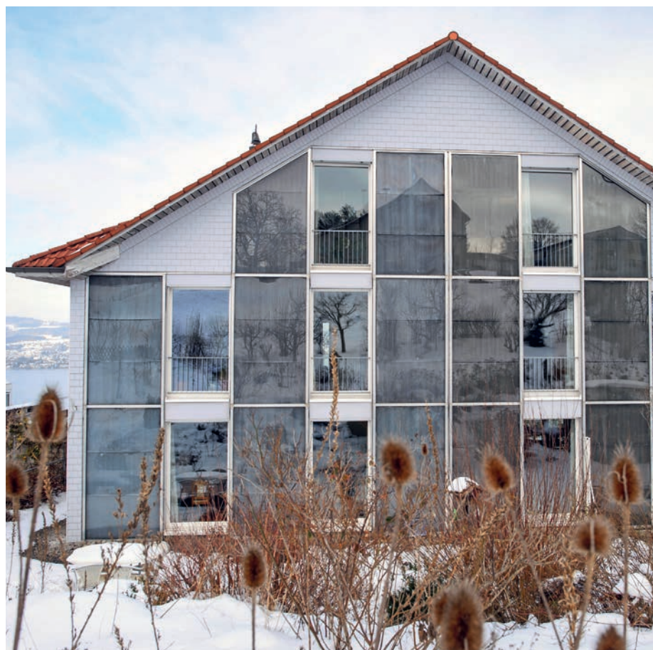
4 Das gleiche Haus seit 2021 mit 7,6 kW PV-Modulen pro Haushälfte. Die in die Fassade eingepasste Anlage wurde durch Alex Gemperle AG, Hünenberg, auf die Unterkonstruktion des früheren Kollektors montiert. Der Wechselrichter mit Batterie von Elektron AG, Au, liefert Notstrom bei Netzausfall. Die modulierende Wärmepumpe von Stiebel Eltron mit Erdsonde konnte auf den kleinen Leistungsbedarf von 4 kW begrenzt werden und sie erlaubt die Kommunikation mit dem Wechselrichter zum bevorzugten Betrieb bei Sonnenschein. Im Holzofen im Haus des Autors wird weiterhin etwa ½ Ster verbrannt.